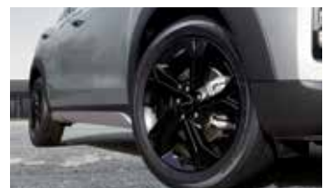
18인치 블랙 다이아몬드 커팅 휠