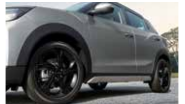
휠 아치 & 사이드 실 가나쉬