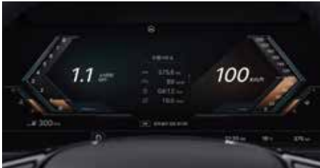
12.3인치 디지털 클러스터 (일반 주행 모드)