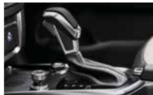
AISIN 6단 자동변속기