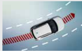
중앙 차선 유지 보조 CLKA