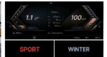
드라이브 모드 시스템

* 일부 지자체 시설 및 주차장에 따라 다를 수 있음 * 티볼리 1.6 가솔린 모델은 해당 안됨