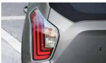
LED 리어 콤비 램프