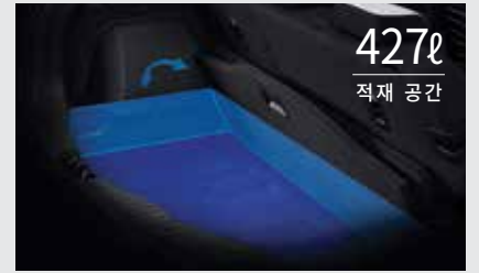
2단 매직 러기지 보드 제거 시