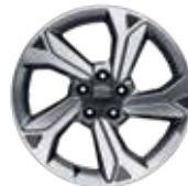
18인치 다이아몬드 커팅 휠