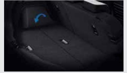
2단 매직 러기지 보드 장착 시