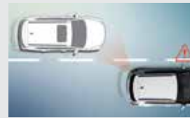
후측방 경고 BSW