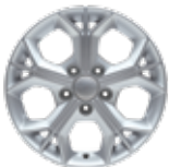
16인치 알로이 휠