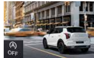
ISG 시스템 (공회전 제한 장치)