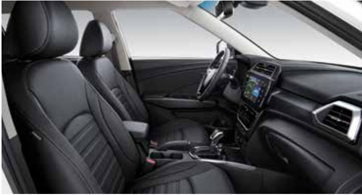
블랙 인테리어(그레이 헤드라이닝)