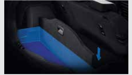
2단 매직 러기지 보드 활용 시