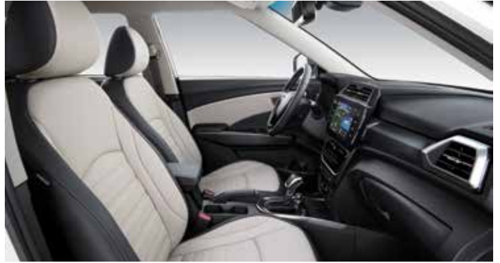
그레이 투톤 인테리어(그레이 헤드라이닝)