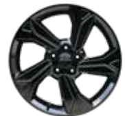
18인치 블랙 다이아몬드 커팅 휠