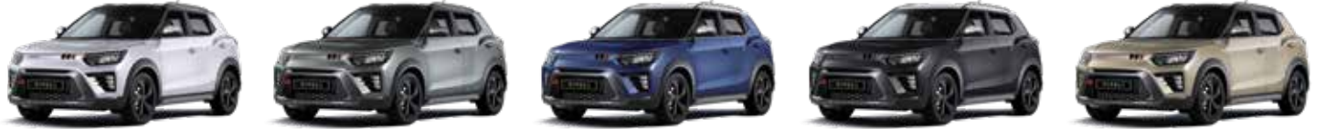
바디컬러/아웃사이드 미러 그랜드 화이트 2WA 루프/리어 스포일러 블랙 바디컬러/아웃사이드 미러 플라즈마 새도우 2DL 루프/리어 스포일러 블랙 바디컬러 덴디 블루 2BS 루프/리어 스포일러/아웃사이드 미러 화이트 바디컬러 스페이스 블랙 2LA 루프/리어 스포일러/아웃사이드 미러 화이트 바디컬러/아웃사이드 미러 라떼 그레이지 2BL 루프/리어 스포일러 블랙

* 투톤 익스테리어 패키지는 V3/V7트림에서 선택 가능 * 투톤 익스테리어 패키지 적용 시 세이프티 선루프 적용 불가 * 블랙 루프 선택 시 아웃사이드 미러 컬러는 바디컬러가 적용되며, 화이트 루프 선택 시 아웃사이드 미러 컬러는 화이트가 적용됨 * 본 가격표에 수록된 제품의 색상은 인쇄된 것이므로 실제 색상과 다소 차이가 있을 수 있습니다.