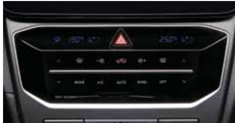
듀얼존 풀오토 에어컨