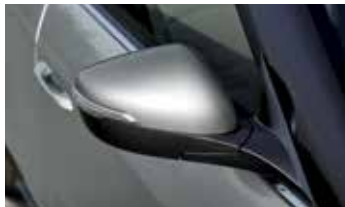
아웃사이드 미러 (LED 턴시그널 램프, 오토폴딩, 열선, 전동조절)