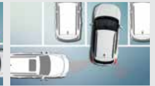
후측방 접근 경고 RCTW 후측방 접근 충돌 보조 RCTA