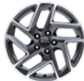
17인치 다이아몬드 커팅 휠