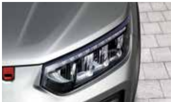
LED 주간 주행등 & Full LED 헤드램프