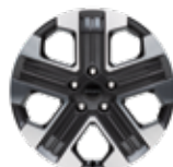
20인치 다이아몬드 커팅 휠