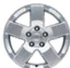
18인치 알루미늄 휠