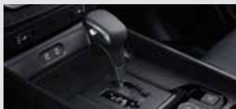
디젤 엔진 전용 센터 콘솔