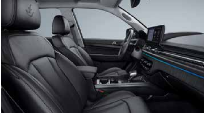
블랙 인테리어(그레이 헤드라이닝)