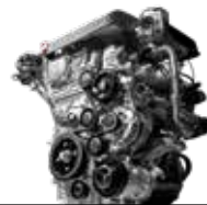
디젤 2.2 LET 엔진 (최고출력 202 ps / 최대토크 45.0 kgf·m)