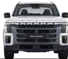
웅장하고 대담한 스타일