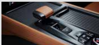
가솔린 엔진 전용 센터 콘솔