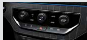
LCD 다이얼 타입 듀얼존 풀오토 에어컨