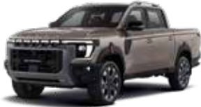
스모크 토포 OBH