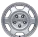
17인치 알루미늄 휠