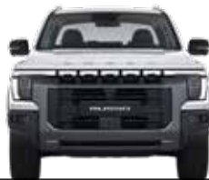
정통 오프로드 스타일