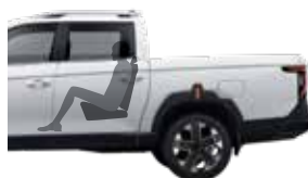
5링크 다이내믹 서스펜션

급격한 코너링이나 험로에서도 안정적인 주행감각을 구현하는 5링크 다이내믹 서스펜션. 적재물 운송 능력을 극대화한 파워 리프 서스펜션, 주행 목적에 맞춰, 가장 완벽한 드라이빙을 완성하세요.