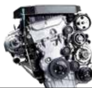
가솔린 2.0 터보엔진 (최고출력 217 ps / 최대토크 38.7 kgf·m)

경쾌한 응답성과 조용하고 안락한 가솔린, 거침없는 파워와 실용적인 유지비의 디젤. 무쏘의 퍼포먼스 캐릭터를 직접 선택하는 즐거움을 누리보십시오.