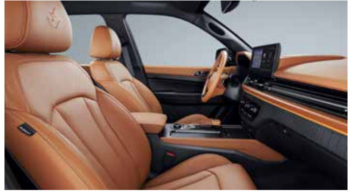
브라운 인테리어(블랙 헤드라이닝)