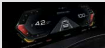
12.3인치 디지털 클러스터(아테나 3.0 GUI 적용)