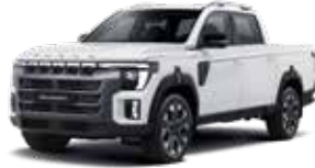
그랜드 화이트 WAA