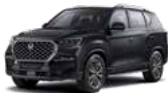
스페이스 블랙 LAK