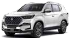
그랜드 화이트 WAA