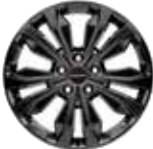
20인치 다크 스포터링 휠