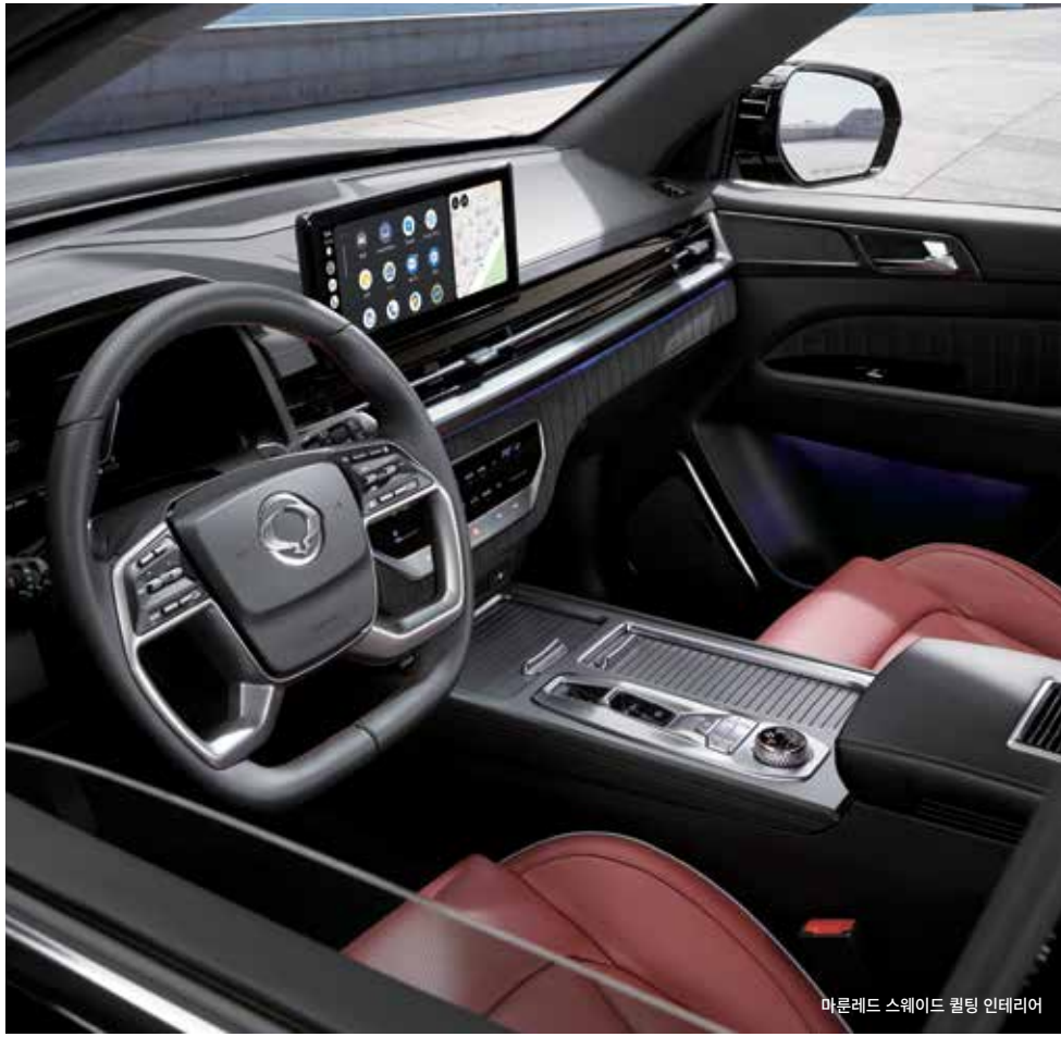
마룬레드 스웨이드 퀵팅 인테리어