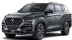
마블 그레이 ACM