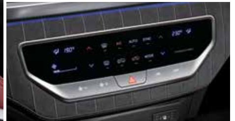
터치식 공조 컨트롤러 (듀얼존 풀오토 에어컨)