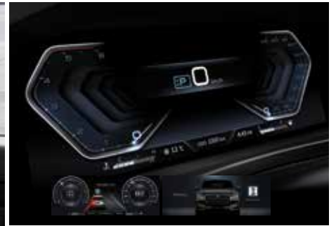
12.3인치 풀 디지털 클러스터 (주행안전 보조시스템 표시, Welcome & Goodbye 모드)