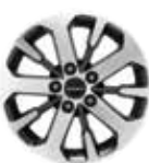
18인치 다이아몬드 컷팅 휠