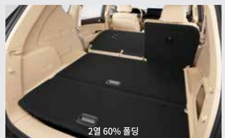
2열 60% 폴딩