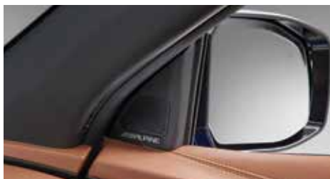
알파인 오디오 시스템