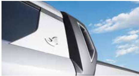
C 필라 가니쉬 & 루프 엠블럼