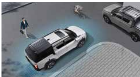
4 Corner BSD