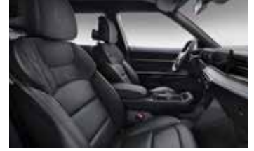
블랙 스웨이드 퀴팅 인테리어 (헤드라이닝 : 블랙)