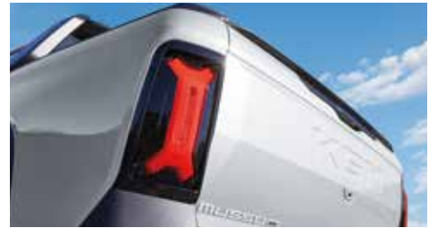
LED 리어 콤비네이션 램프