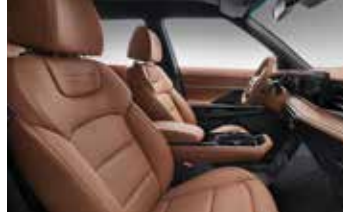
브라운 인테리어 (헤드라이닝 : 블랙)