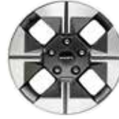
17인치 다이아몬드 커팅 휠