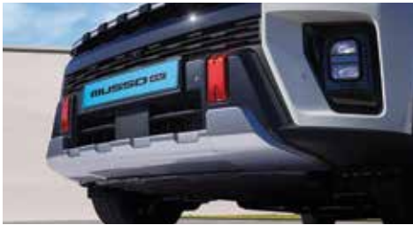
프론트 스킵드 플레이트