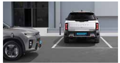
후진 충돌 방지 보조/후진 충돌 방지 경고