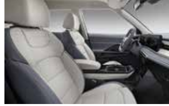
그레이 투톤 인테리어 (헤드라이닝 : 그레이 / 천연 가죽에는 지오닉 소재 적용(숄더 / 도어 센터 커버))