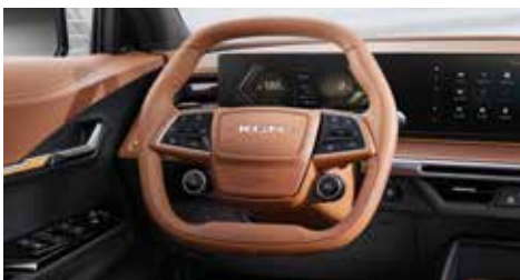
더블 D컷 스티어링 휠