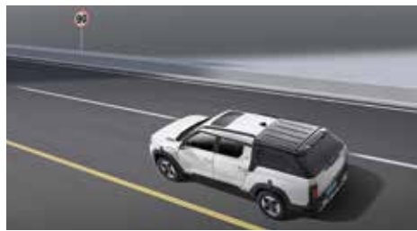
지능형 차량 속도 제어