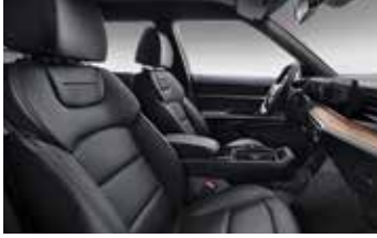
블랙 인테리어 (헤드라이닝 : 블랙)

* 지오닉 소재는 고성능성 소재로 내마모성, 내열성, 내오염성이 있는 특수 소재임