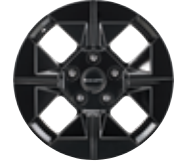
17인치 블랙 다이아몬드 커팅 휠