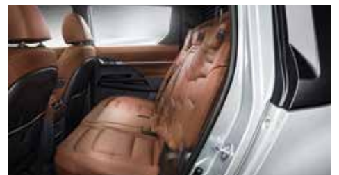
2열 시트 슬라이딩 & 리클라이닝