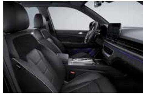
블랙 인테리어(블랙 헤드라이닝)