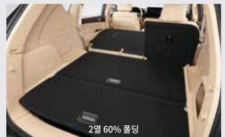
2열 60% 폴딩