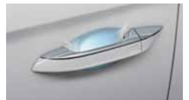
터치센싱 도어핸들 (1열)