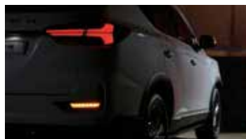
LED 리어 콤비네이션 램프 & 후방 다이내믹 턴 시그널 램프