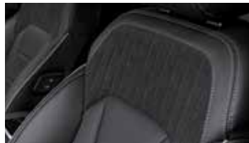
나파 가죽 퀴팅 시트 & 블랙 스웨이드 퀴팅