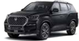
스페이스 블랙 LAK