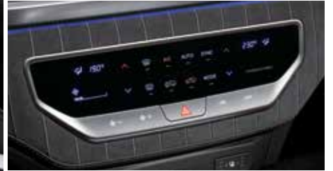
터치식 공조 컨트롤러 (듀얼존 풀오토 에어컨)