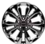
20인치 스퍼터링 휠