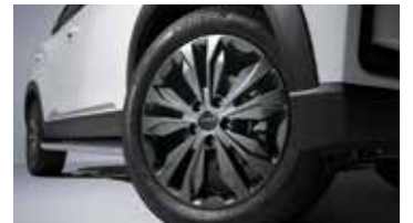
20인치 다크 스포터링 휠