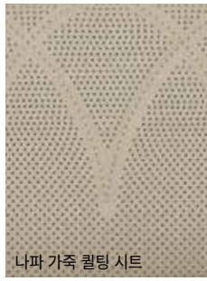
나파 가죽 퀵팅 시트