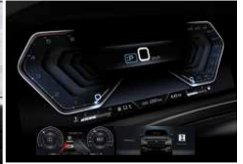
12.3인치 풀 디지털 클러스터 (주행안전 보조시스템 표시, Welcome & Goodbye 모드)