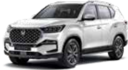
그랜드 화이트 WAA