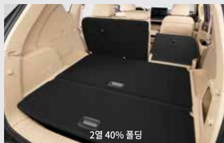
2열 40% 폴딩