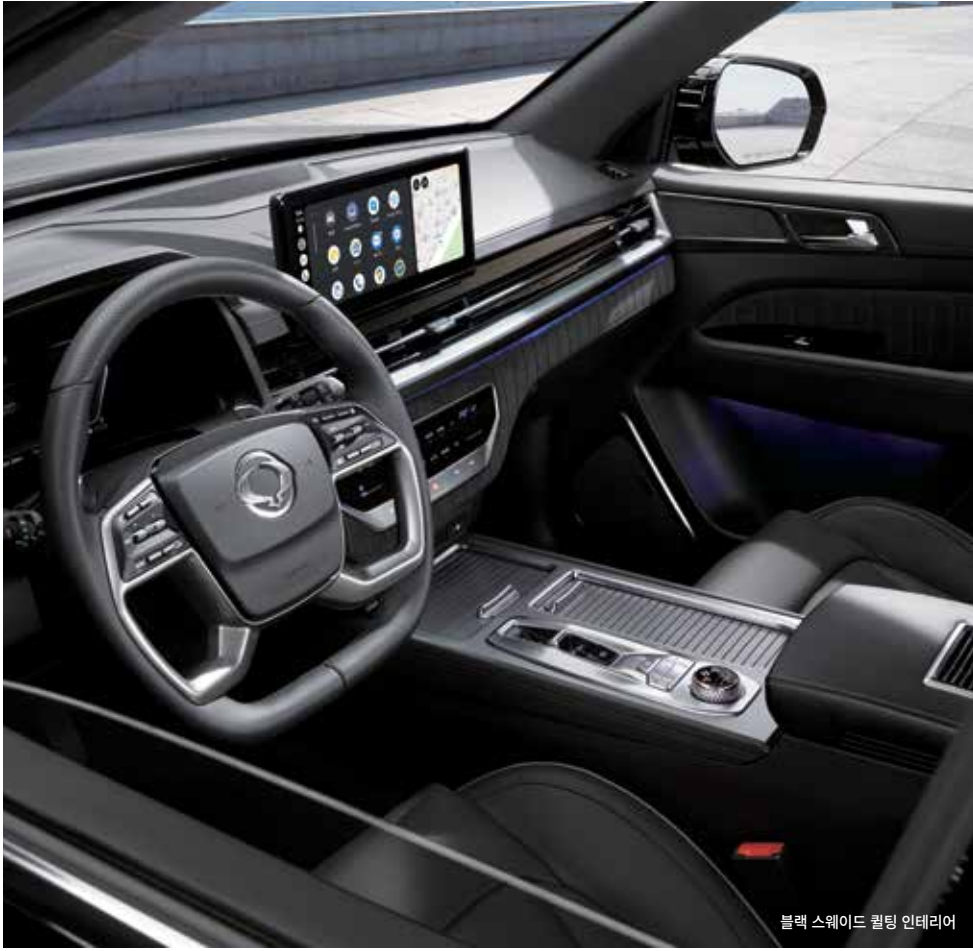
블랙 스웨이드 퀼팅 인테리어