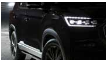
FULL LED 프로젝션 헤드램프 (4구 점등, 상하향등, 다이내믹 턴 시그널 램프)