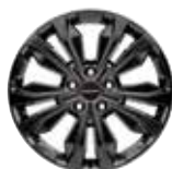
20인치 다크 스퍼터링 휠