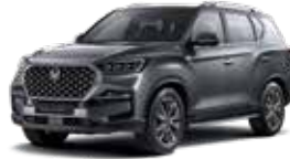
마블 그레이 ACM