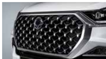
다이아몬드 셰이프 라디에이터 그릴 (사틴 실버컬러 페인팅)