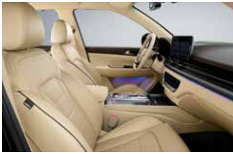
클래시컬 베이지 인테리어(베이지 헤드라이닝)