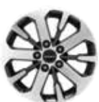
18인치 다이아몬드 컷팅 휠