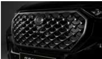
블랙 라디에이터 그릴 & 블랙 전면 윈로고